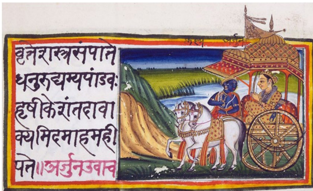
Кришна рассказывает Арджуне Бхагавад-гиту

грузы. Однажды калека водрузил на спину быка тяжелую ношу. Хозяин стал очень быстро погонять быка, но тот неожиданно упал и потерял сознание. Собравшиеся вокруг люди наблюдали за происходящим и сочувствовали быку. Один благочестивый человек даровал быку результаты каких-то своих благих поступков. Видя это, другие люди начали вспоминать свои благие дела и предлагать результаты этой деятельности быку. В толпе была одна проститутка, которая даже не знала, совершила ли она за свою жизнь хоть какое-то благое дело, но, видя, как это делают другие, она тоже предложила быку результаты своей благочестивой деятельности. После этого бык умер и попал в обитель Ямараджи, бога смерти. Ямараджа сообщил ему: «Теперь ты свободен от последствий всех своих грехов благодаря благочестию, отданному тебе той проституткой».