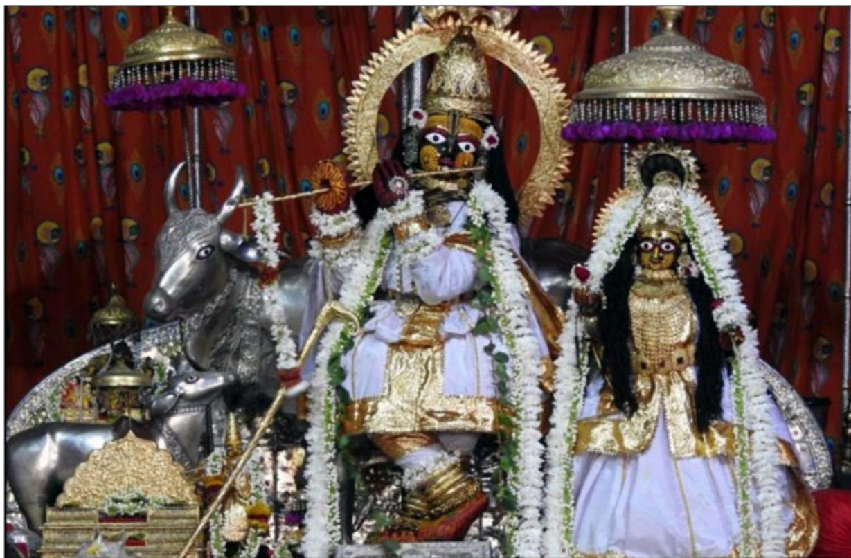
Фотограф: Нигин, Джайпур.